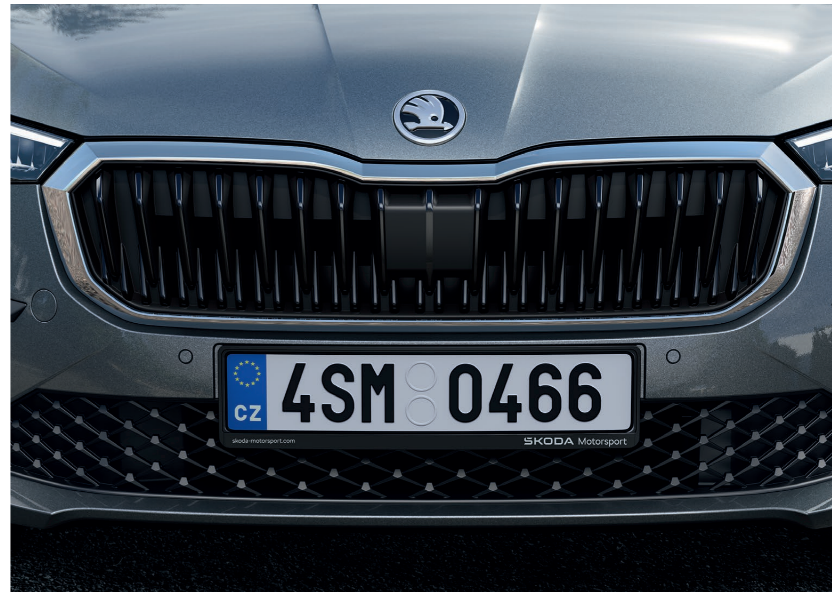
Držák registrační značky – Škoda Motorsport