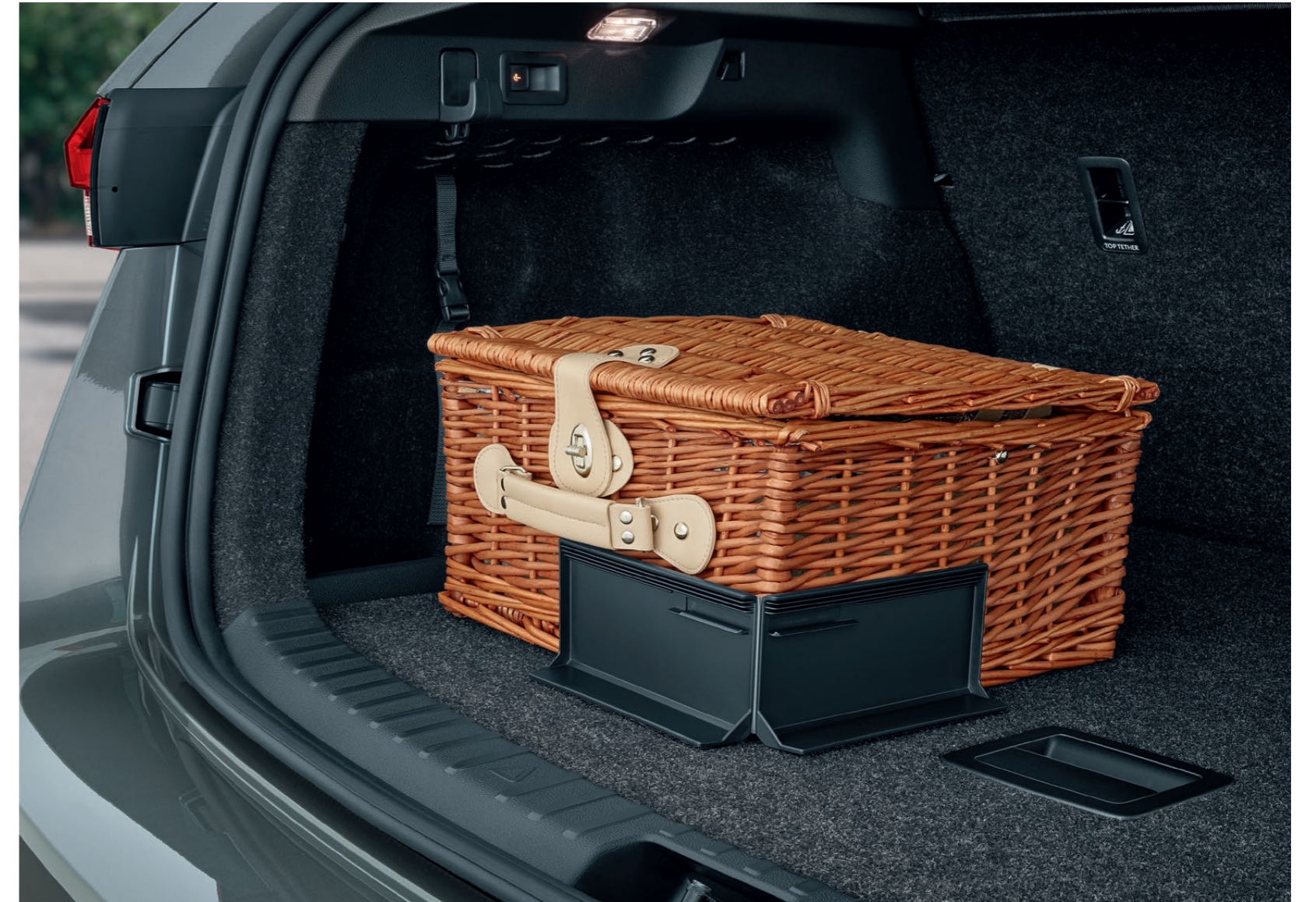
Univerzální fixační element