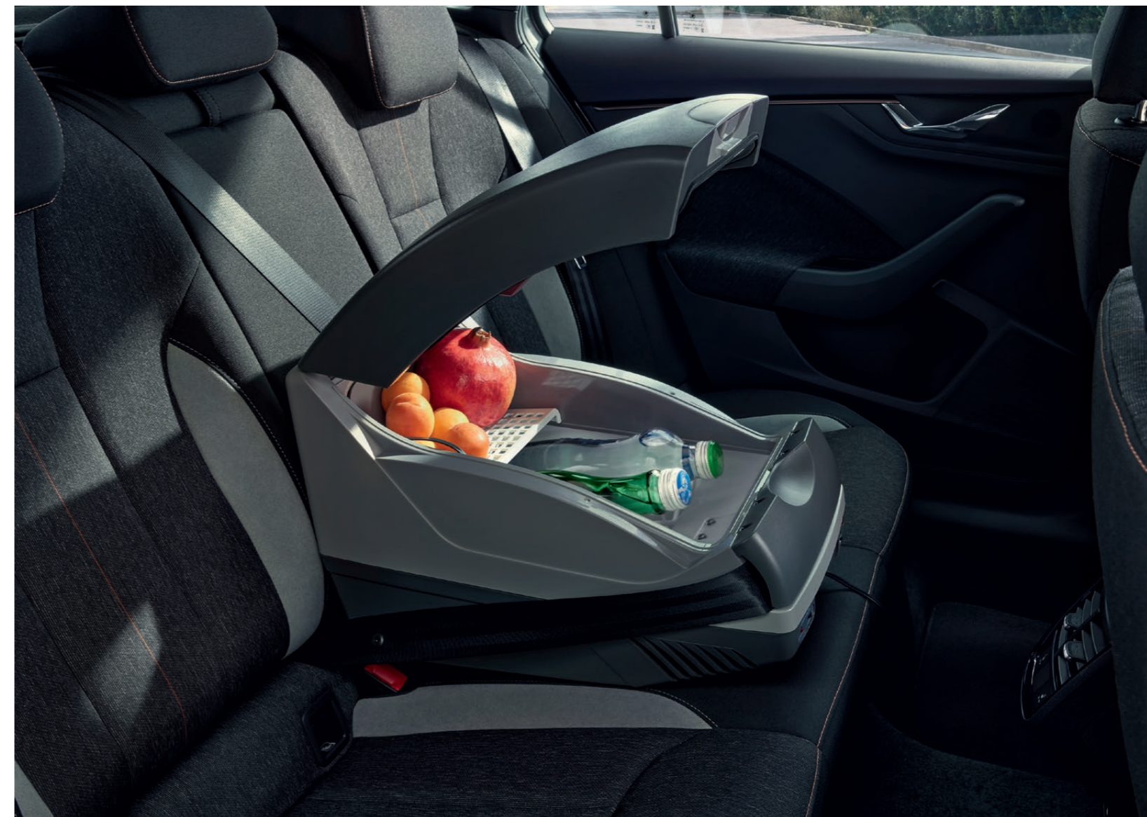
Termoelektrický chladicí/ohřevný box (15 l)