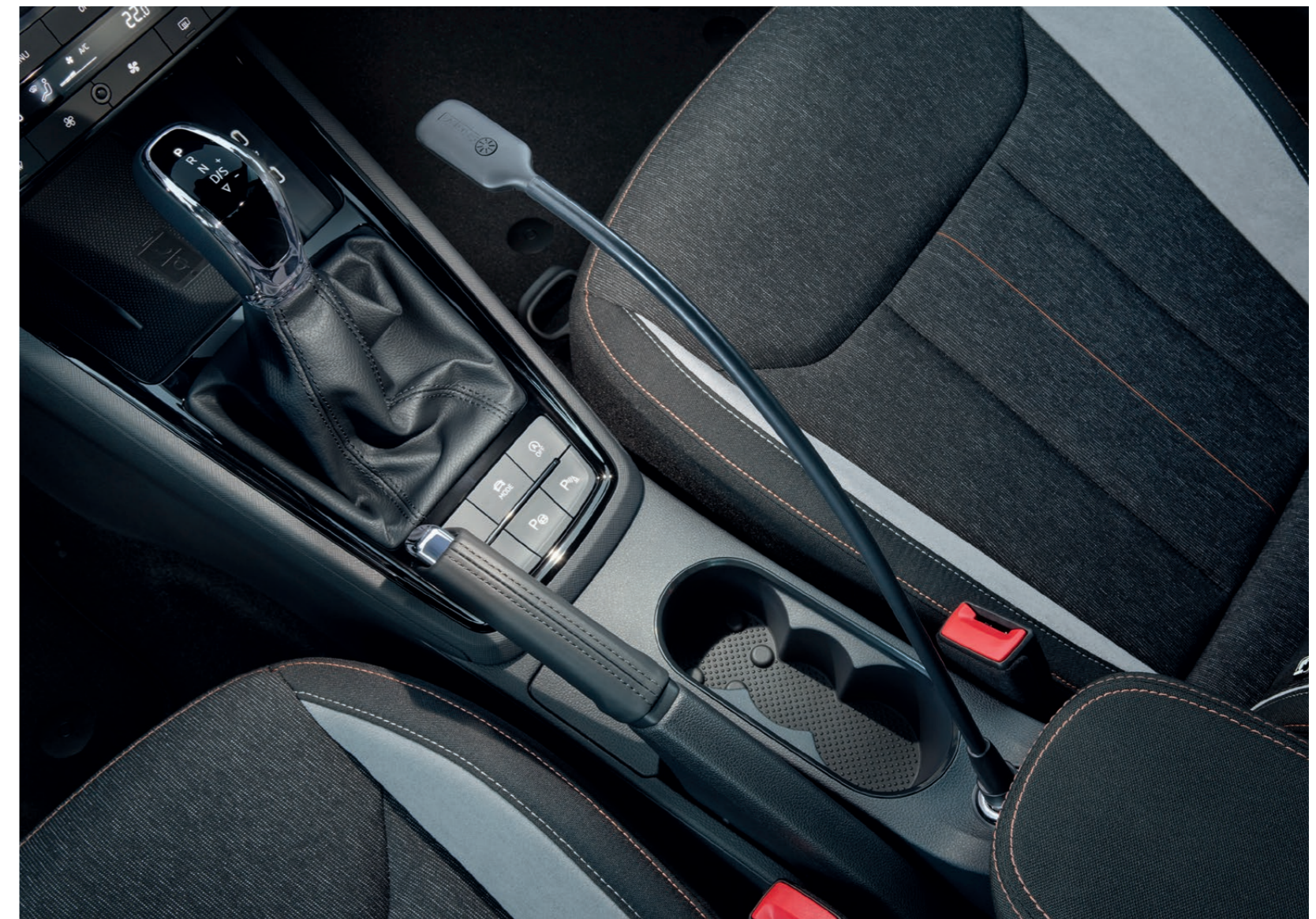
LED lampička (12 V)