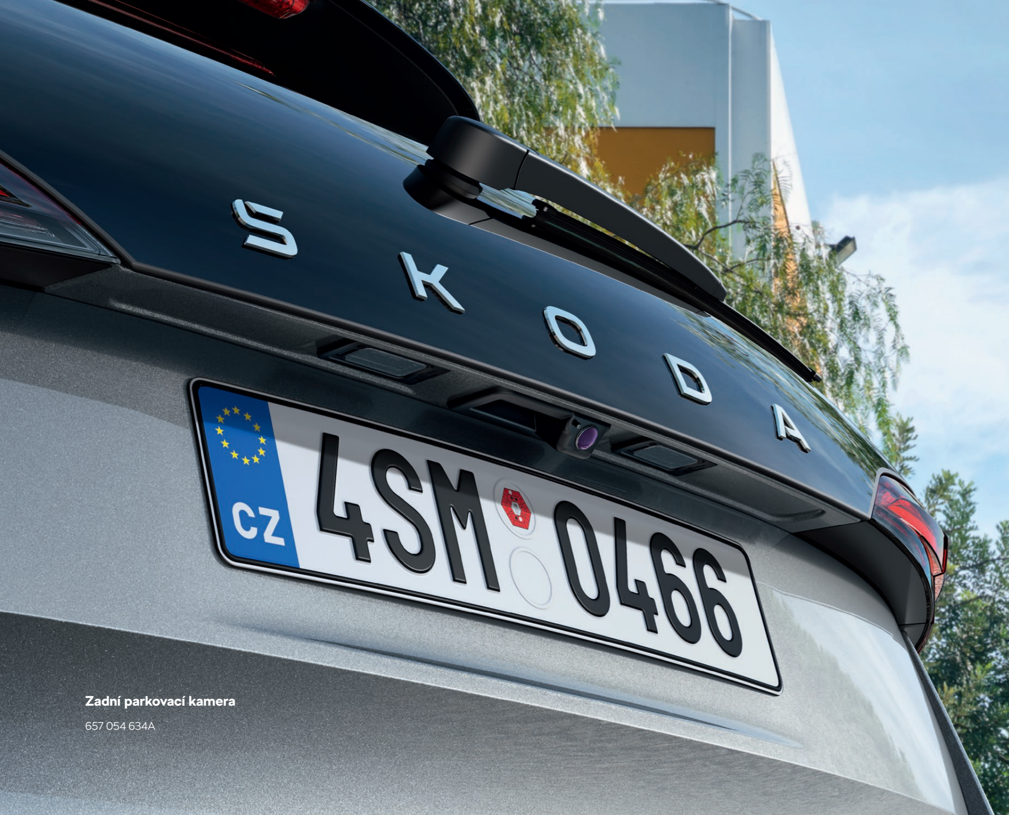
Zadní parkovací kamera