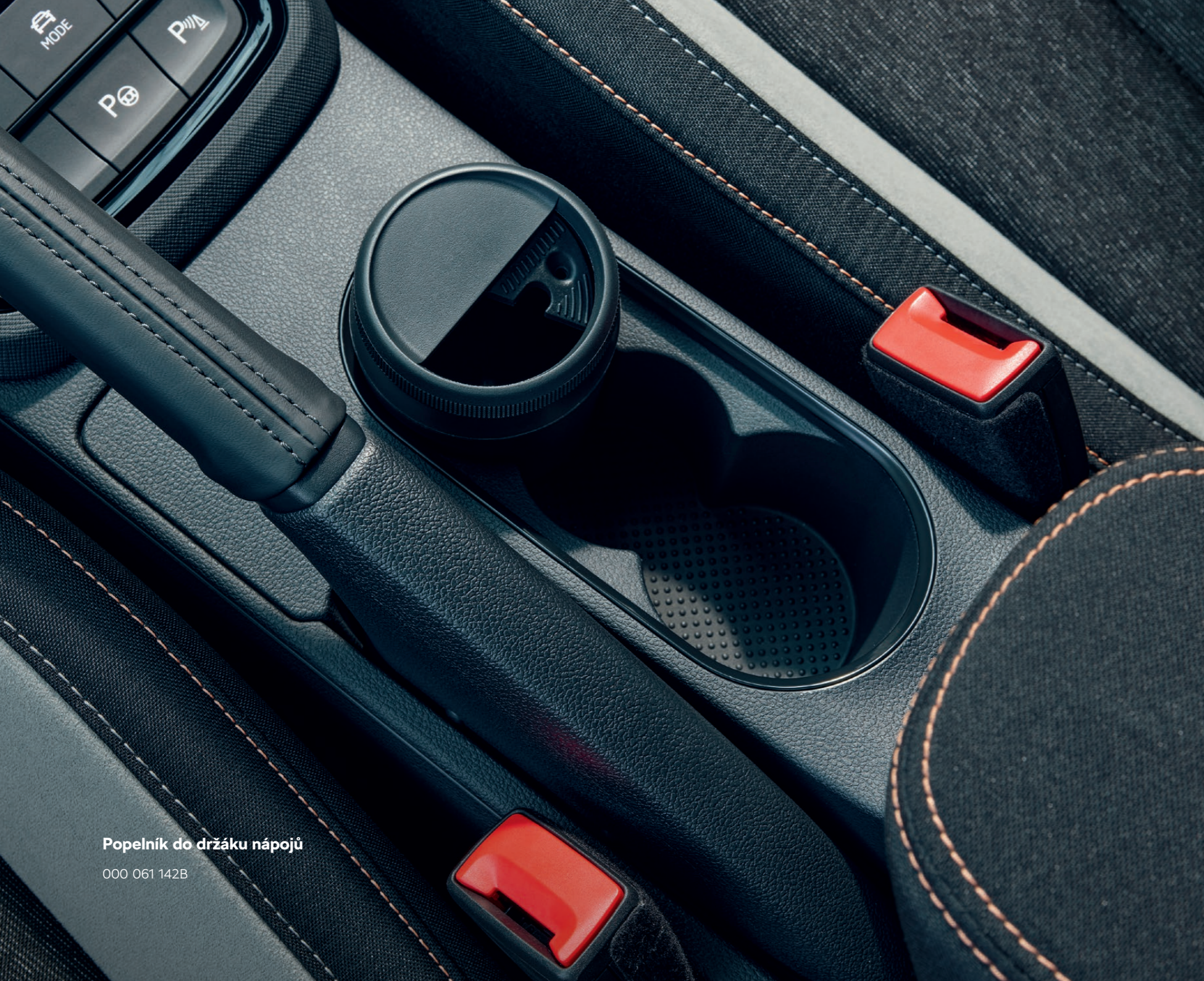
Popelník do držáku nápojů