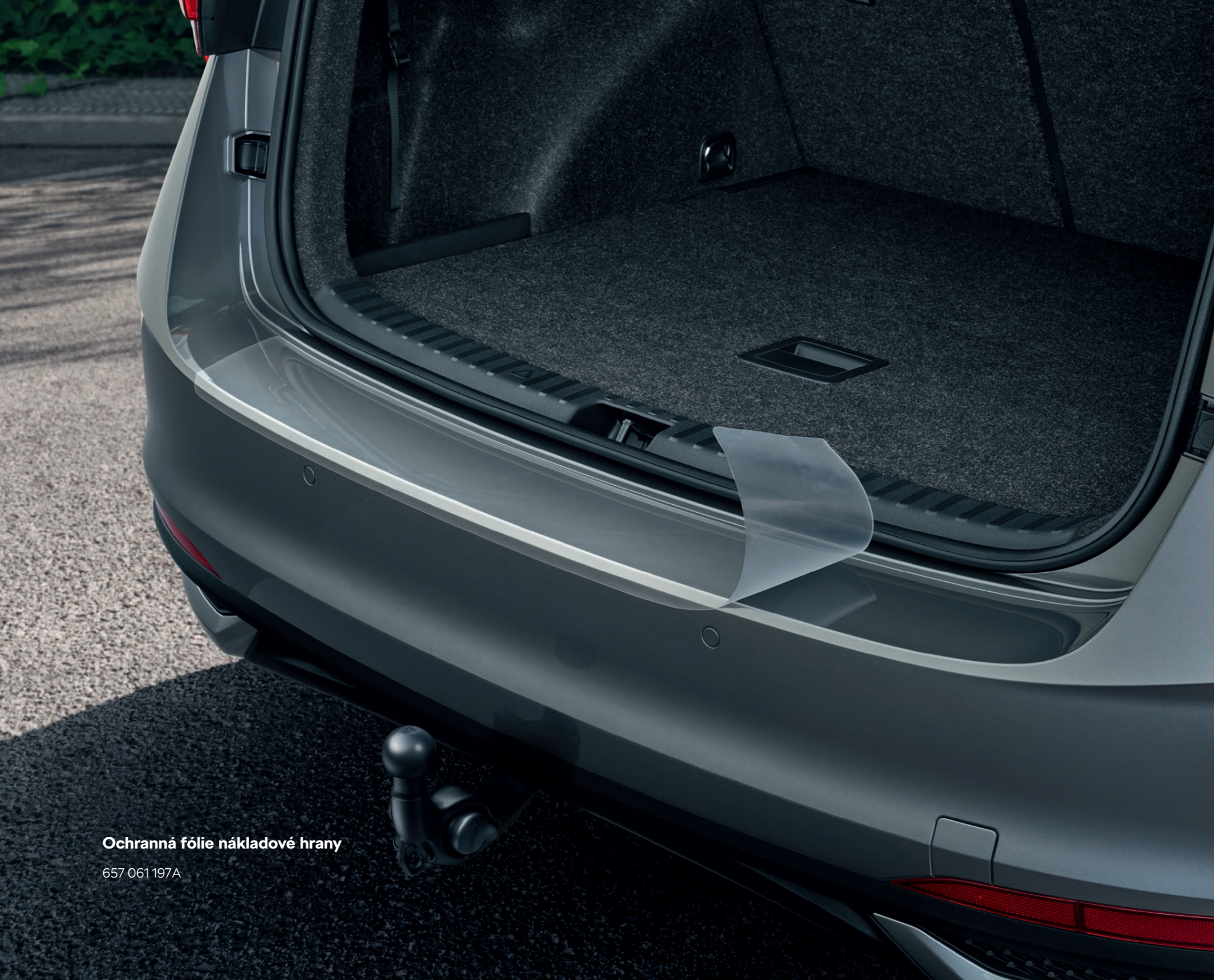
Ochranná fólie nákladové hrany