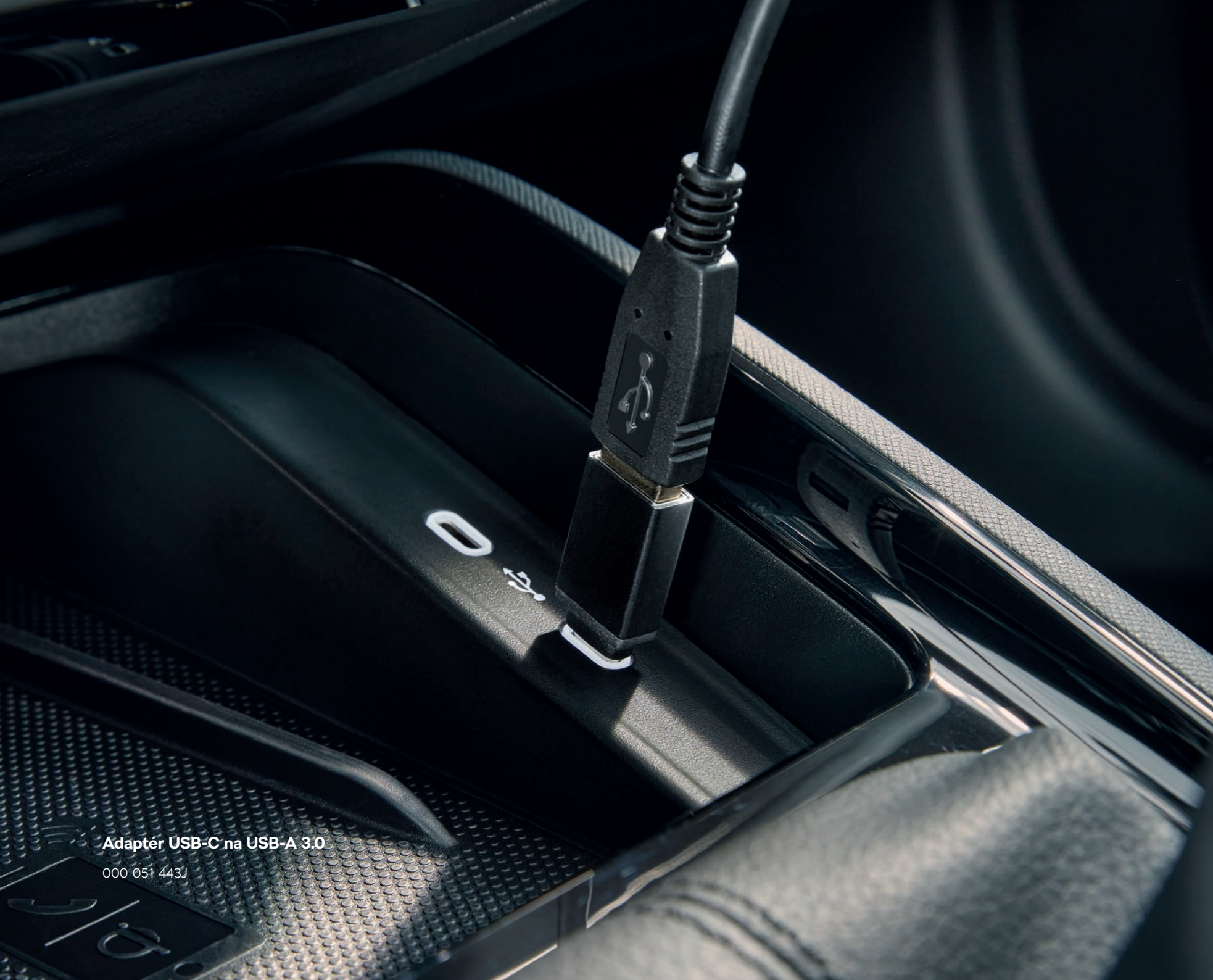
Adaptér USB-C na USB-A 3.0