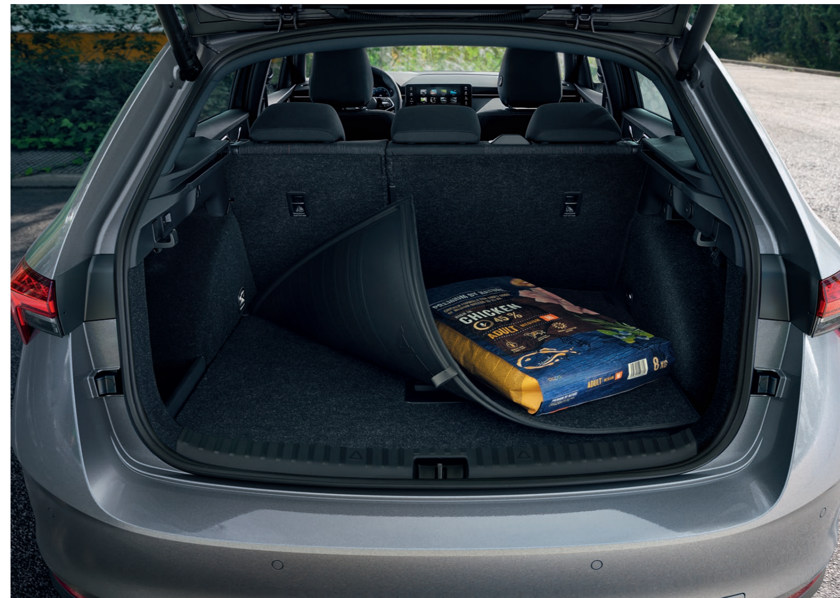
Oboustranný koberec do zavazadlového prostoru