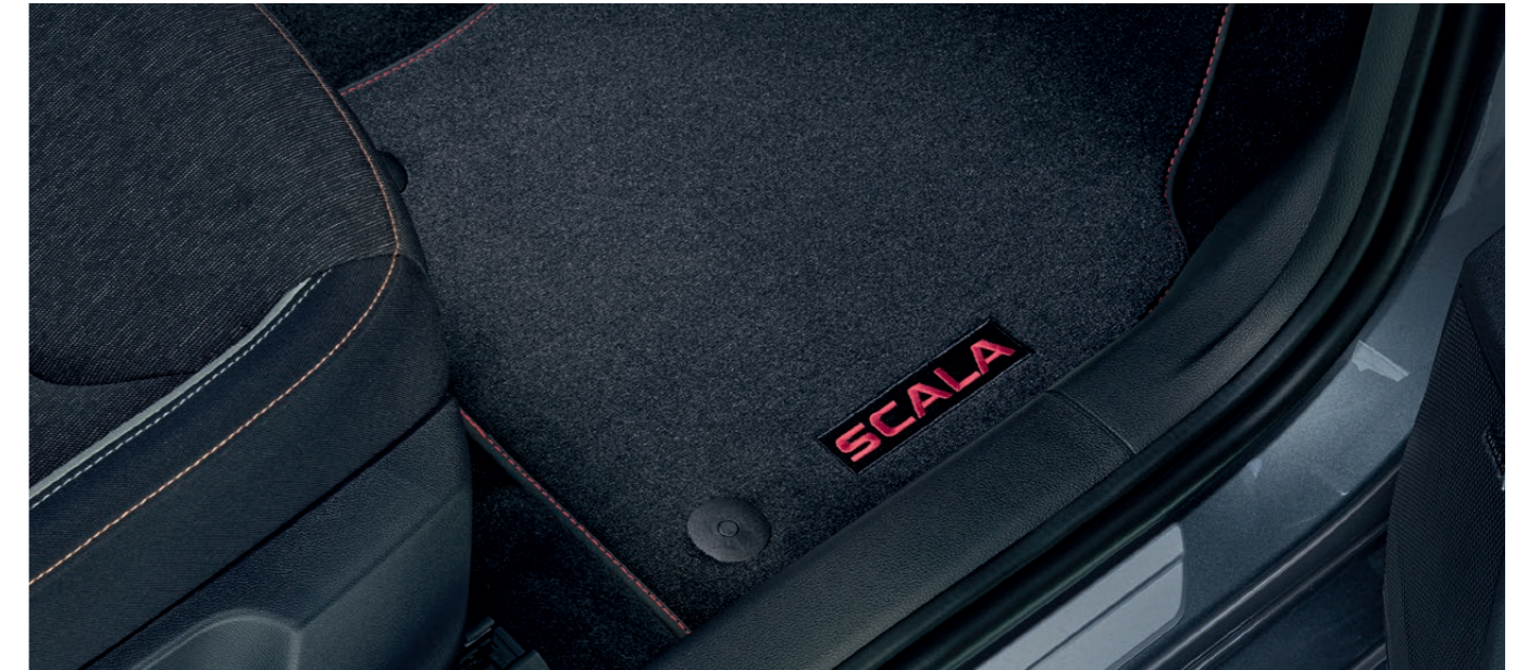
Textilní koberce Prestige – měděná