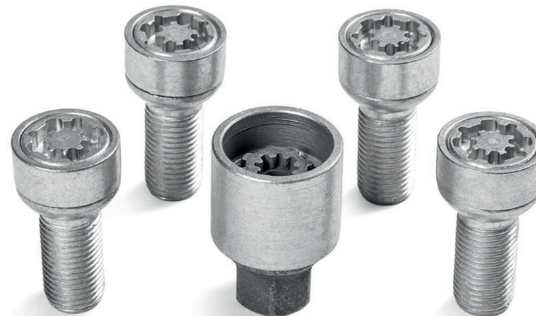
Bezpečnostní šrouby kol