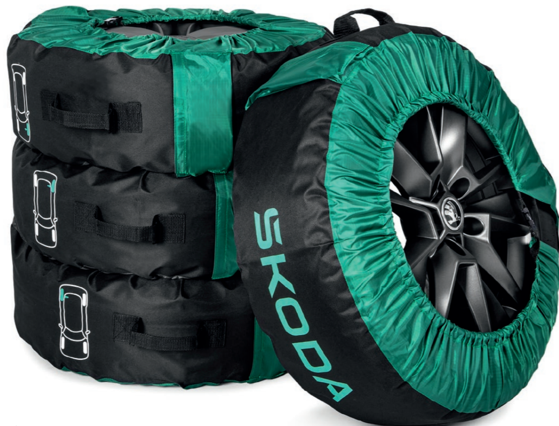
Obaly na kompletní sadu kol

Kola jsou pro vůz totéž co pro vás boty. Ať už je váš vůz Škoda „obutý“ stylově, sportovně, nebo funkčně, naše příslušenství pro kola nabízí celou řadu produktů, díky kterým budou vaše kola ještě atraktivnější a zcela jedinečná.