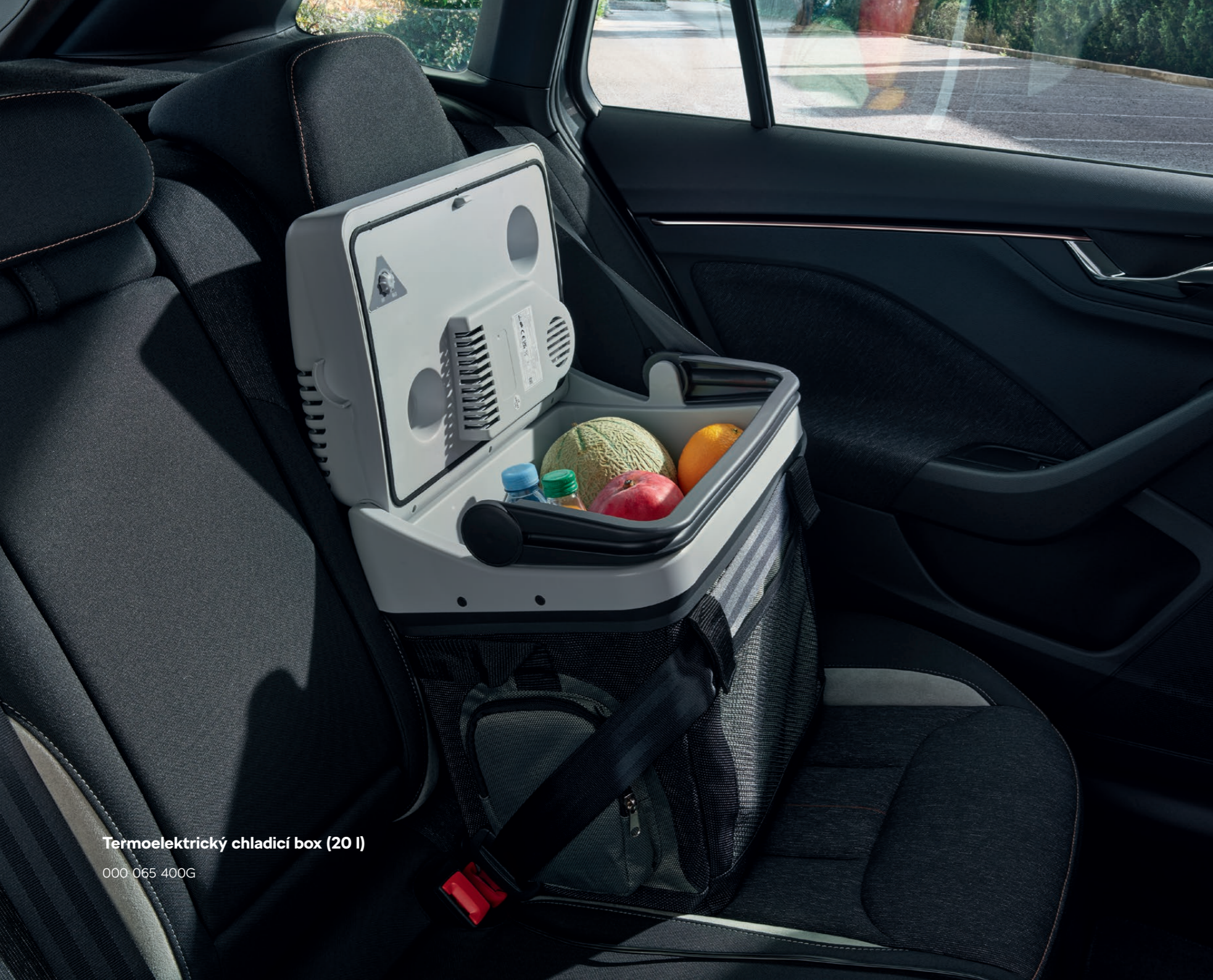
Termoelektrický chladicí box (20 l)