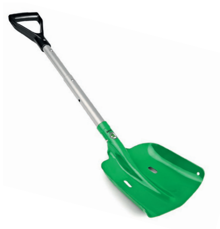
Skládací lopata na sníh

000 093 056K | oranžová 000 093 056L | žlutá