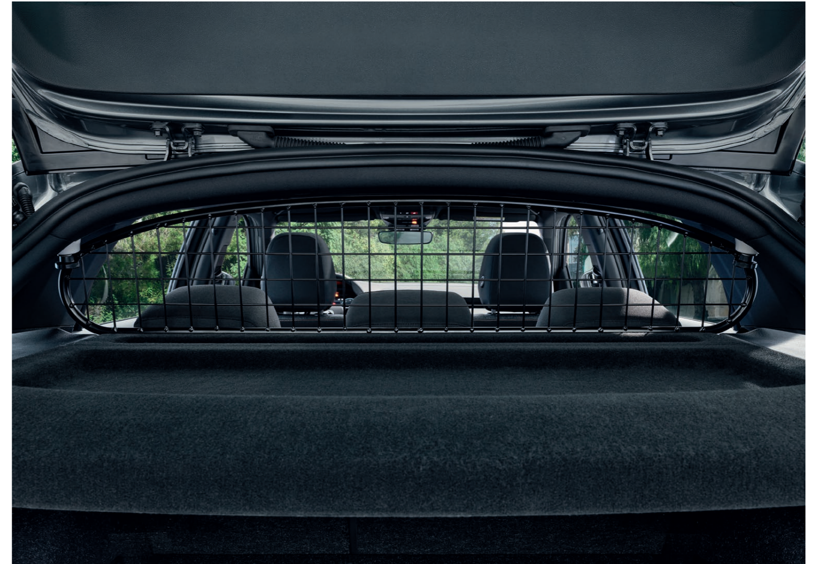
Příčná mříž do zavazadlového prostoru