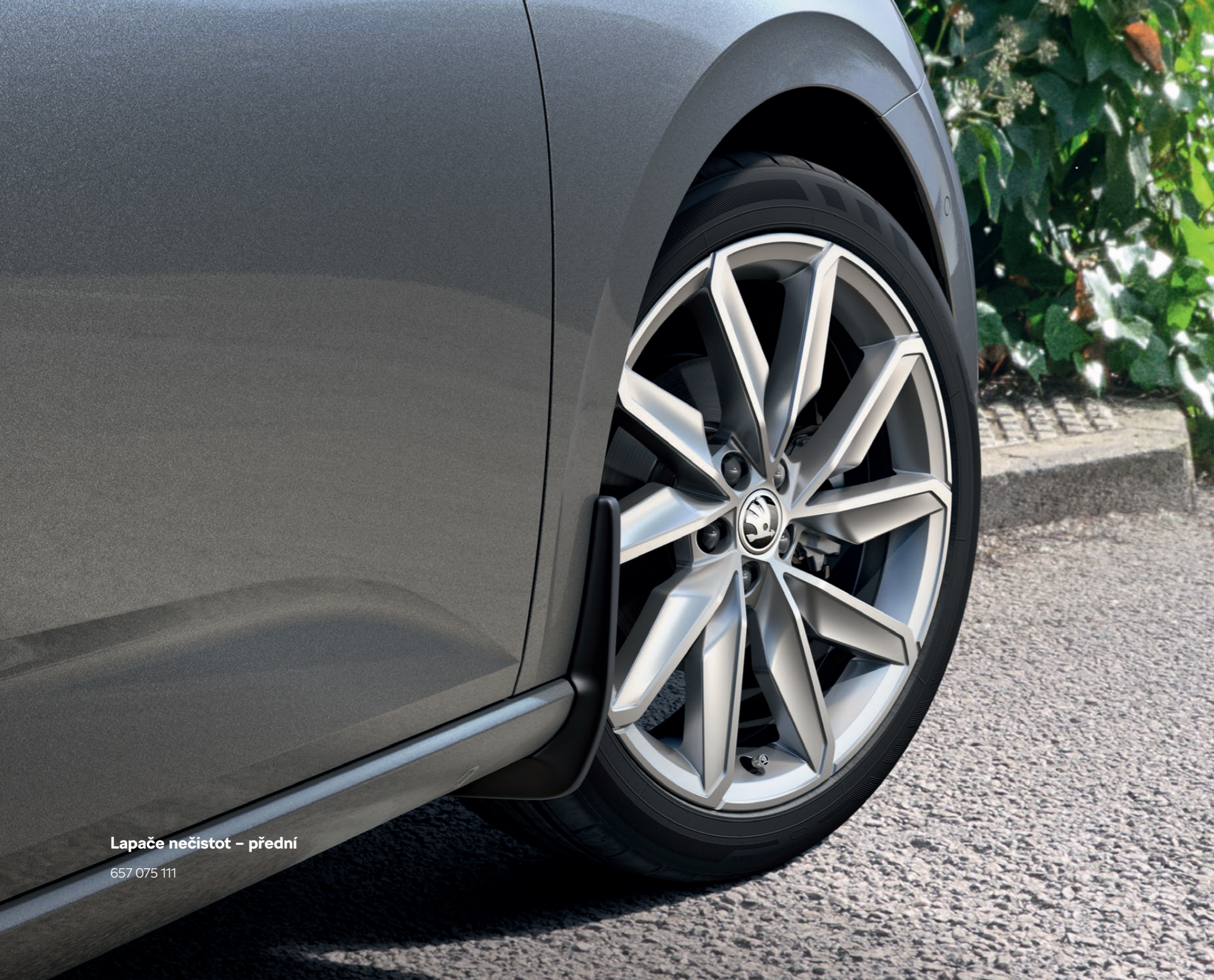
Lapače nečistot – přední