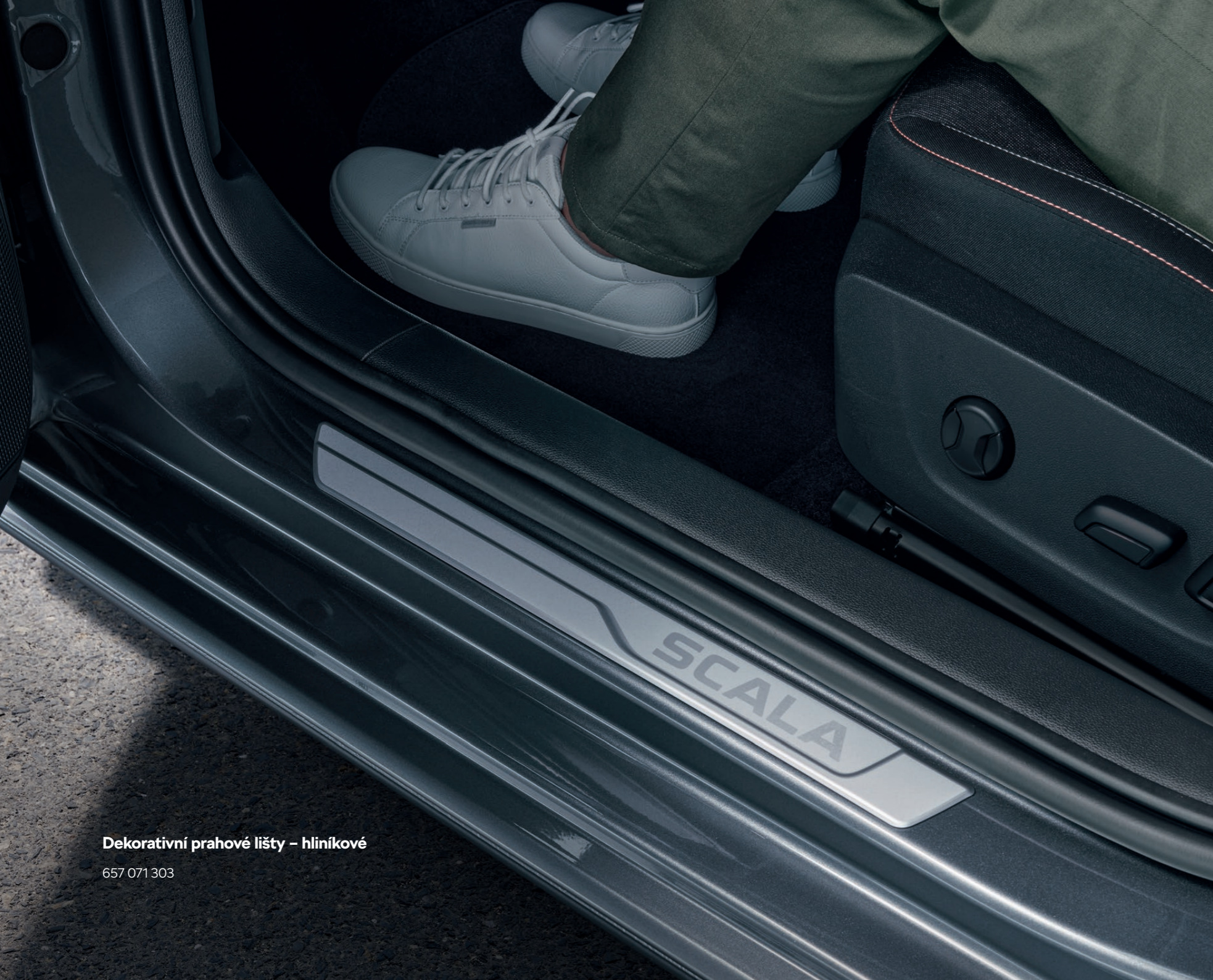
Dekoratívni prahové lišty – hliníkové