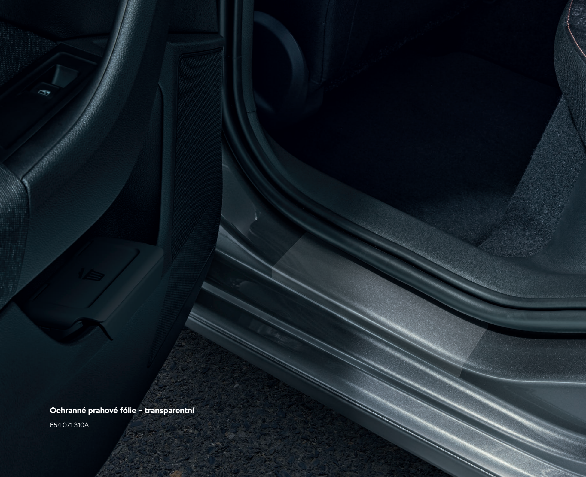
Ochranné prahové fólie – transparentní