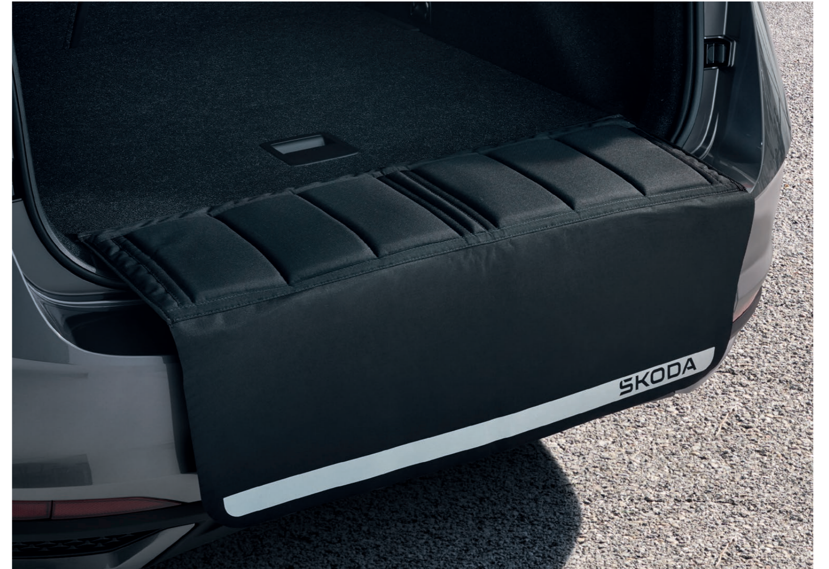
Ochranný přehoz nákladové hrany