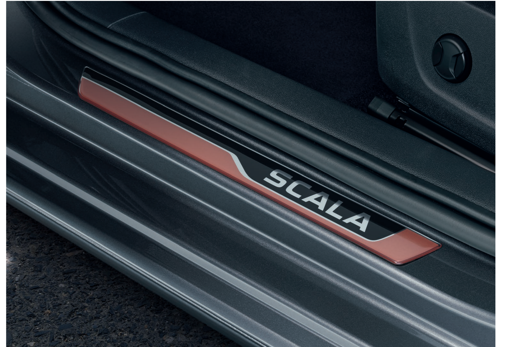
Dekoratívni prahové fólie 3D – měděná