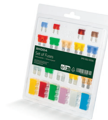
Sada náhradních pojistek