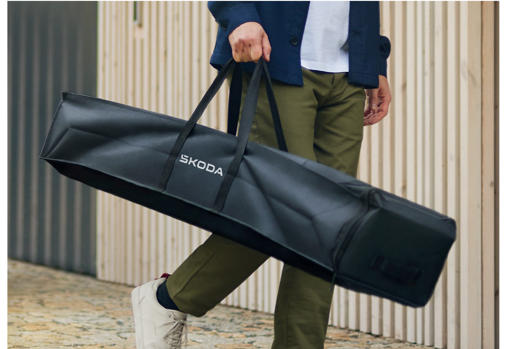
Vak na střešní nosiče