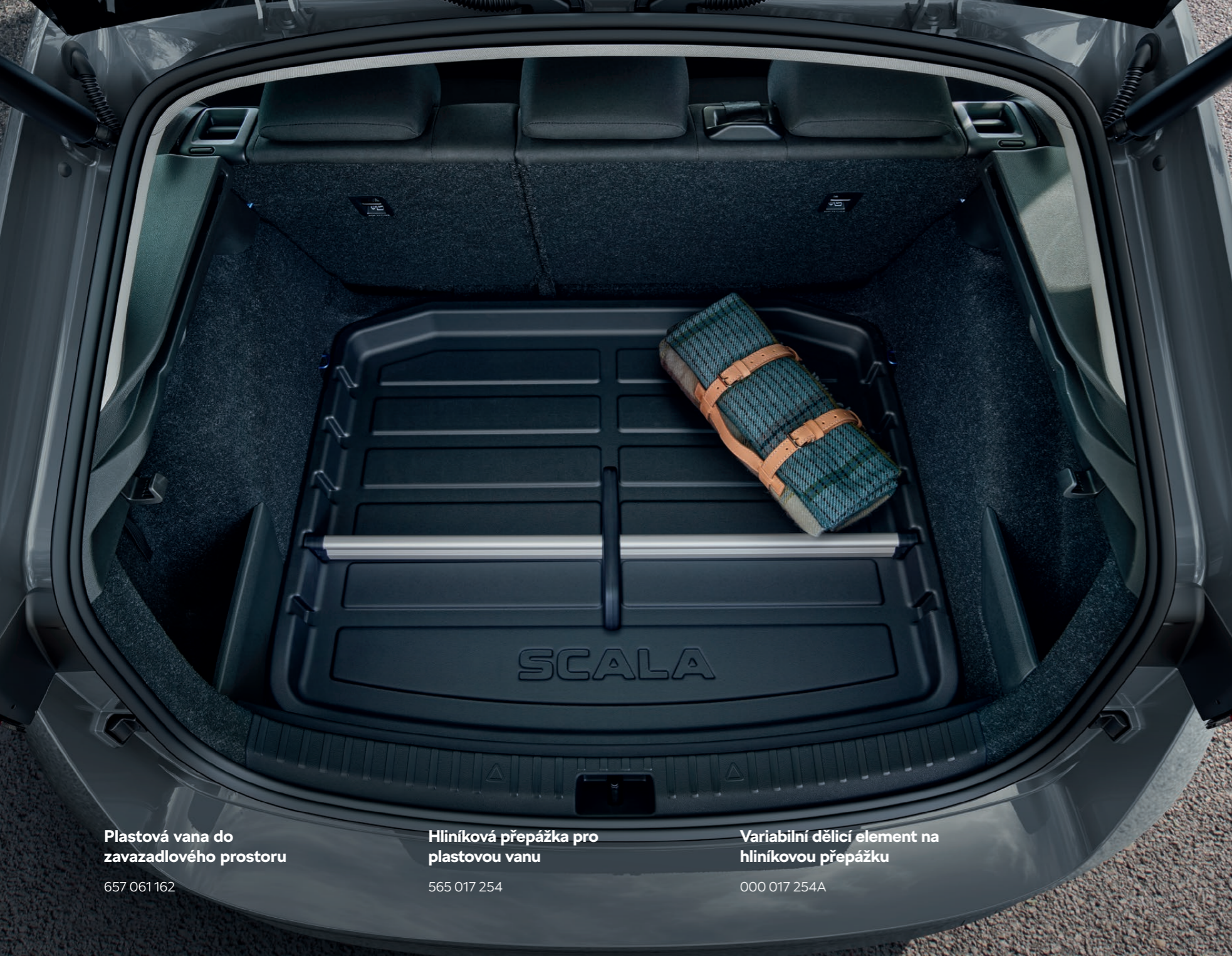
Plastová vana do zavazadlového prostoru