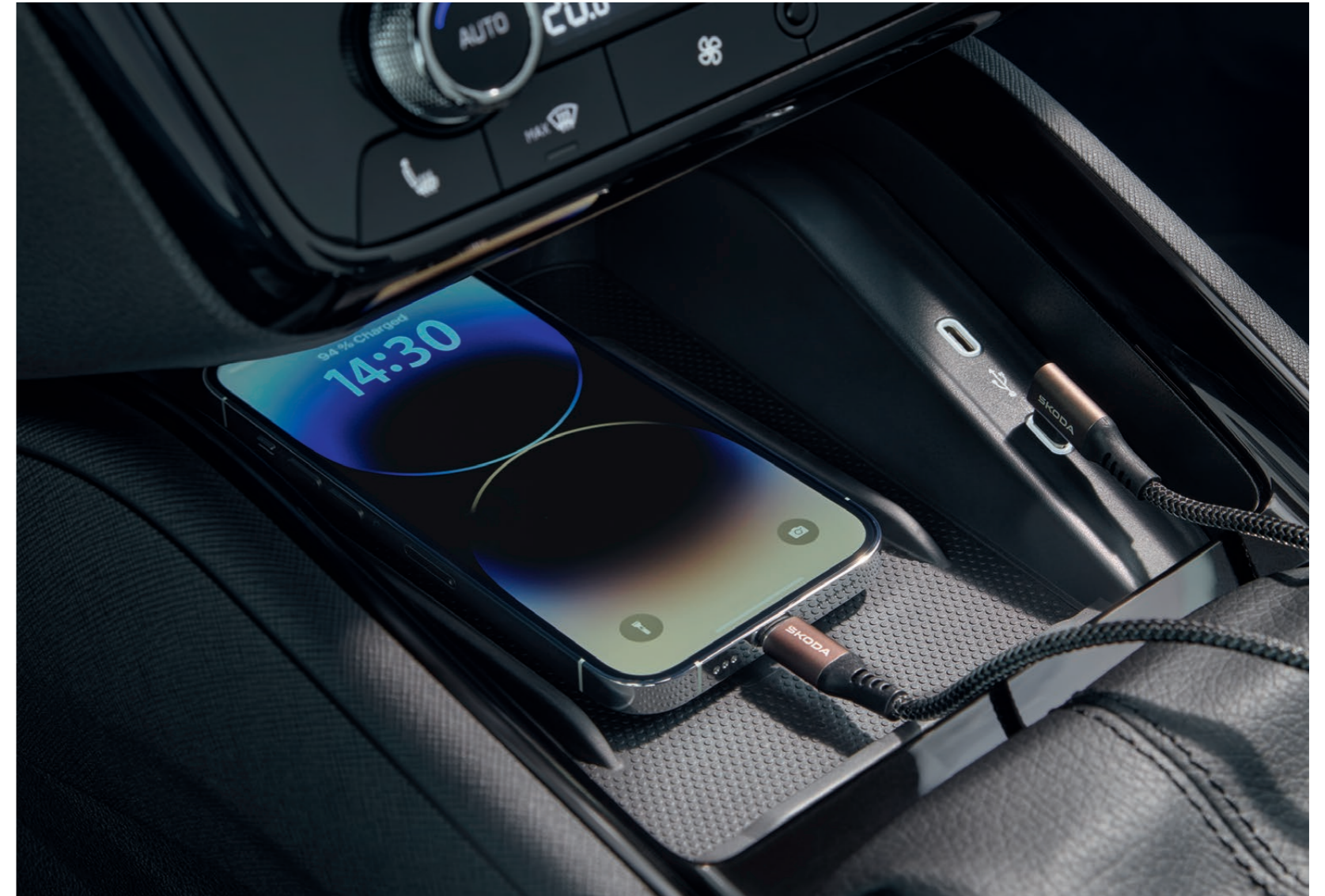
Nabíjecí a datový kabel