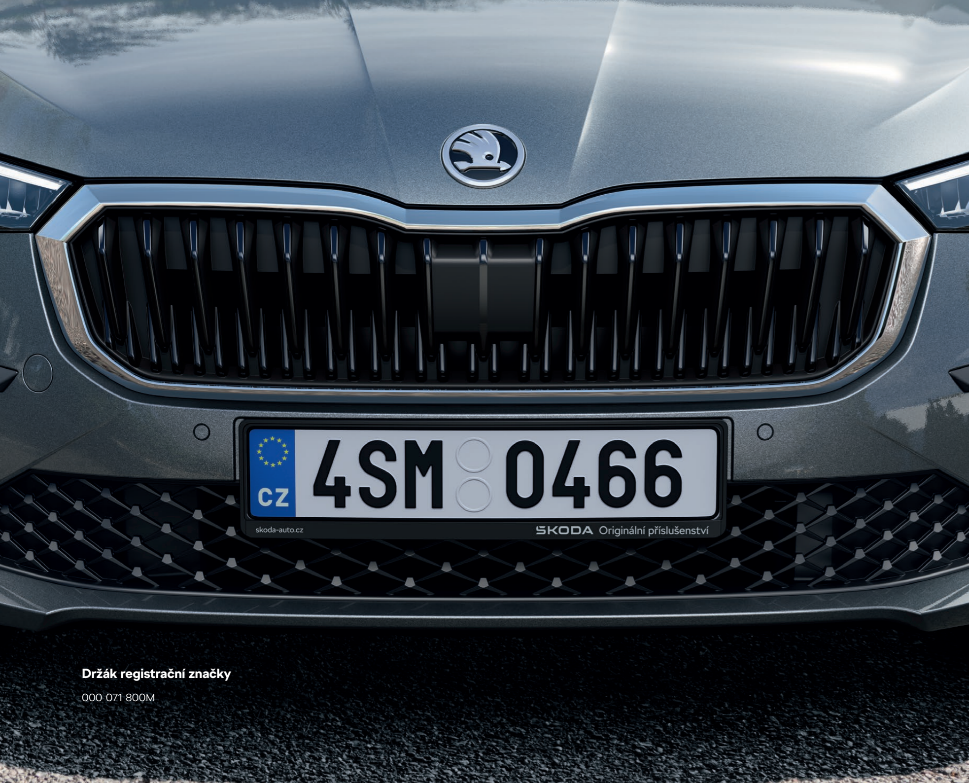
Držák registrační značky