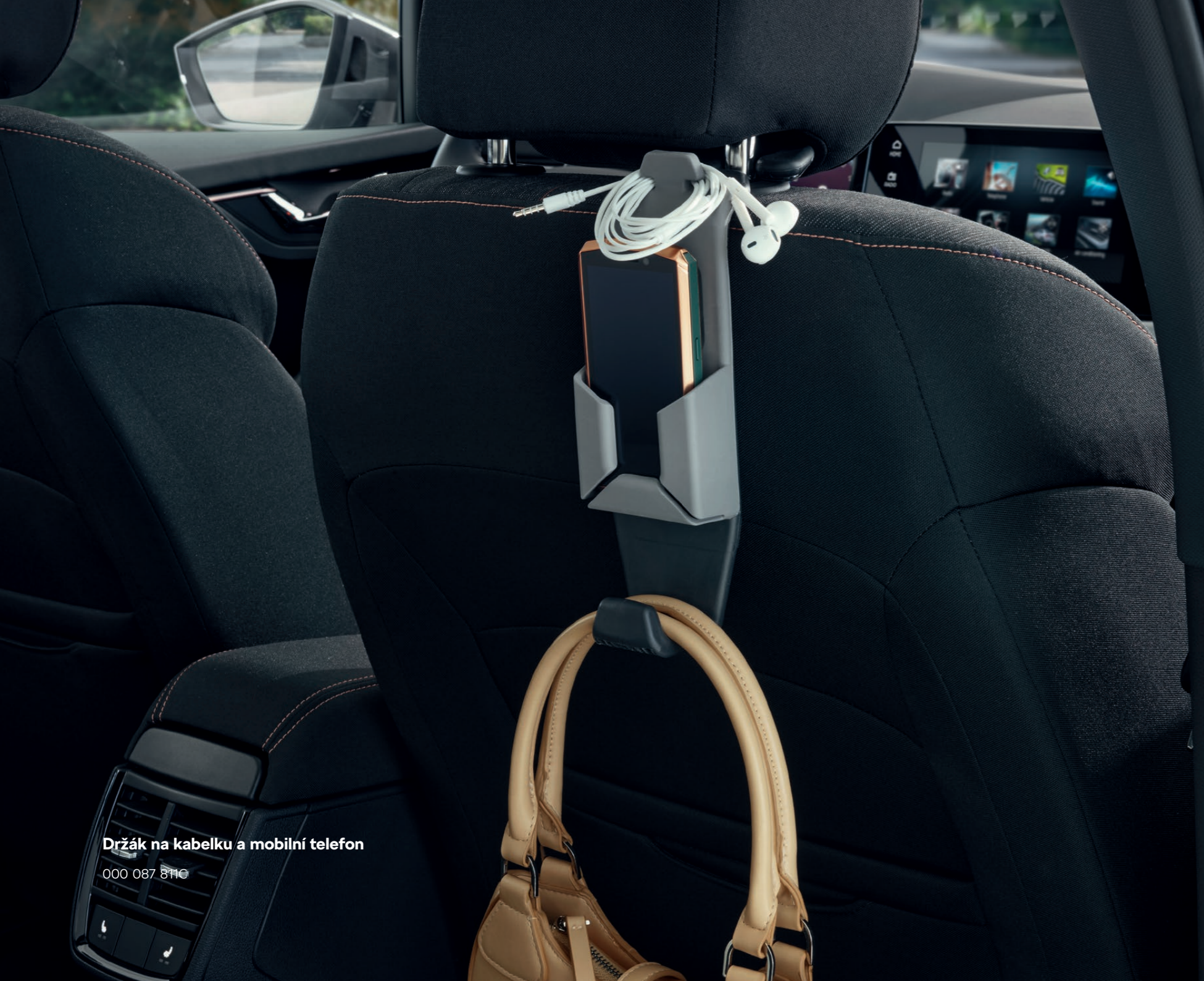
Držák na kabelku a mobilní telefon