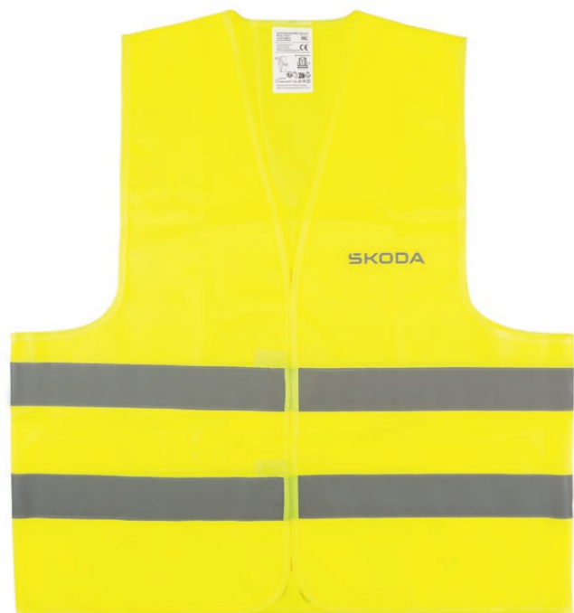
Reflexní výstražná vesta

000 093 056K | oranžová 000 093 056L | žlutá