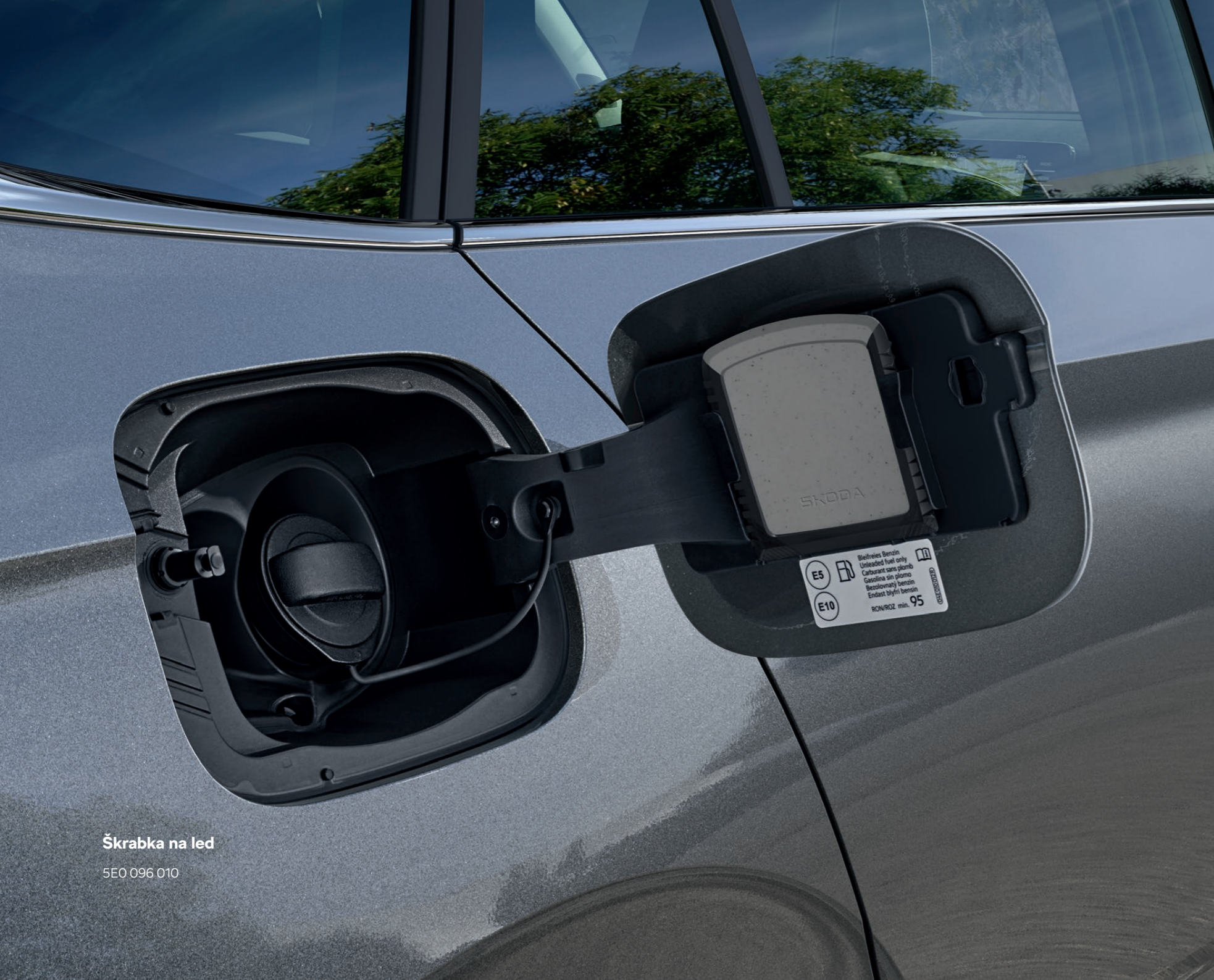
Škrabka na led