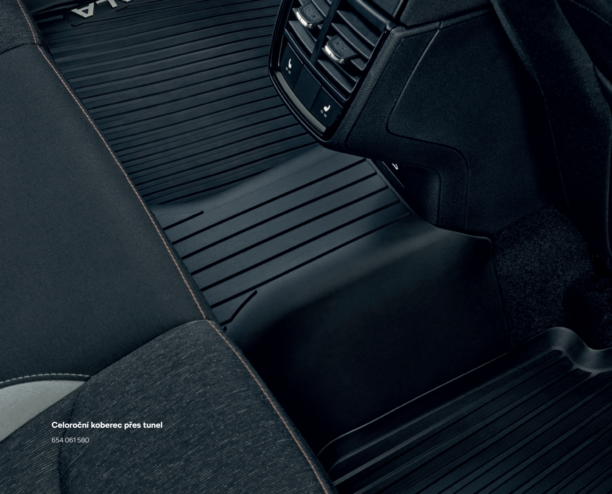
Celoroční koberec přes tunel