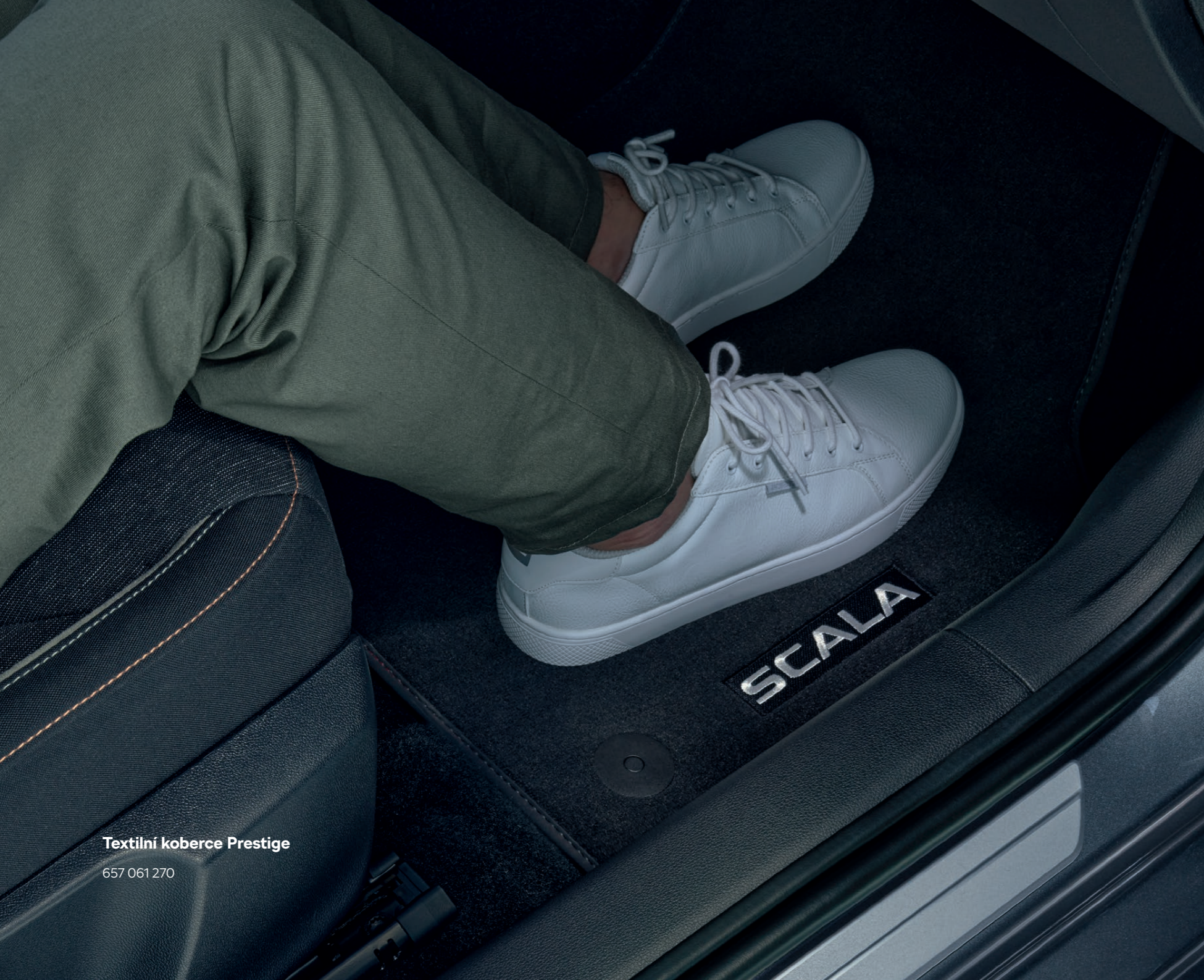
Textilní koberce Prestige