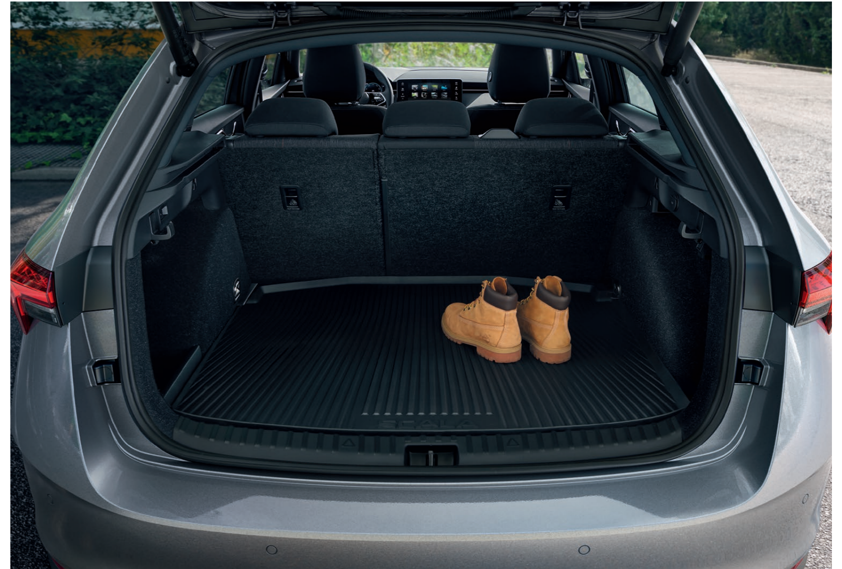
Ochranná vložka do zavazadlového prostoru