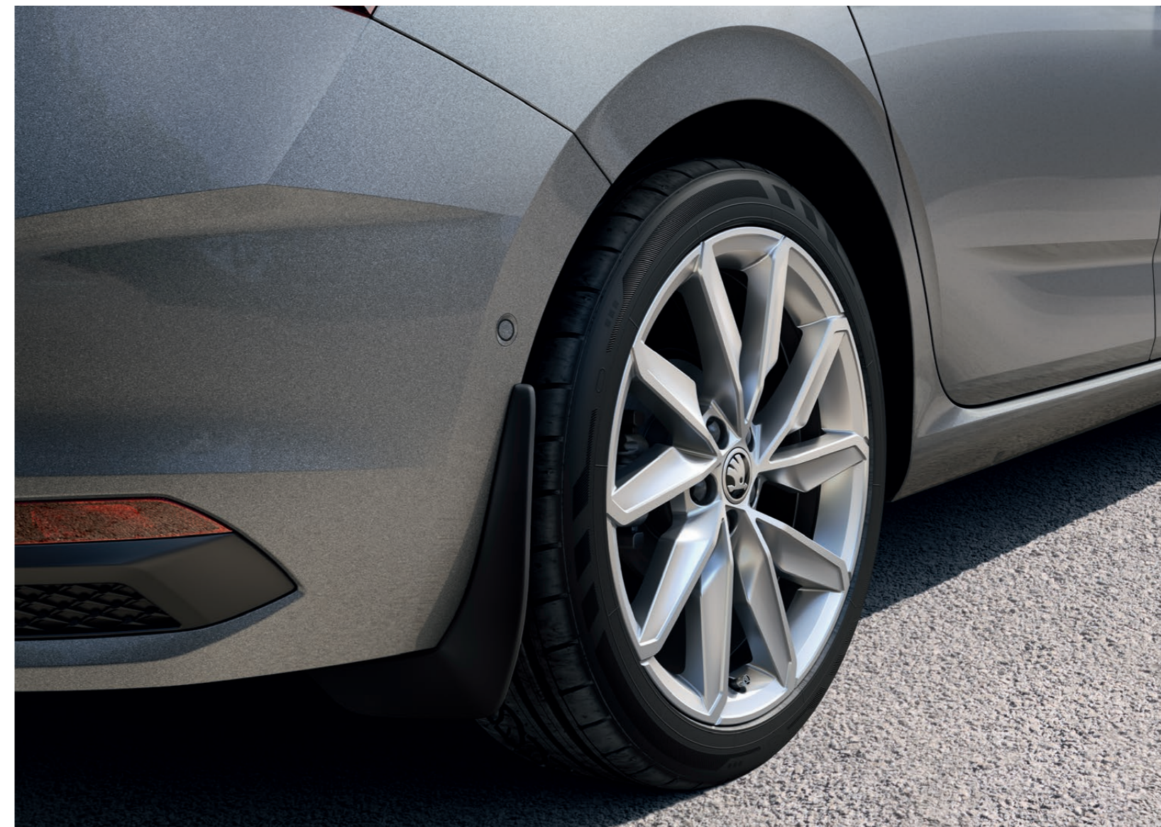
Lapače nečistot – zadní