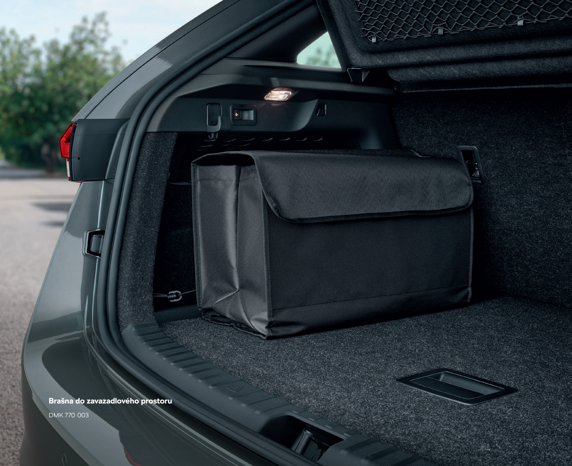
Brašna do zavazadlového priestoru