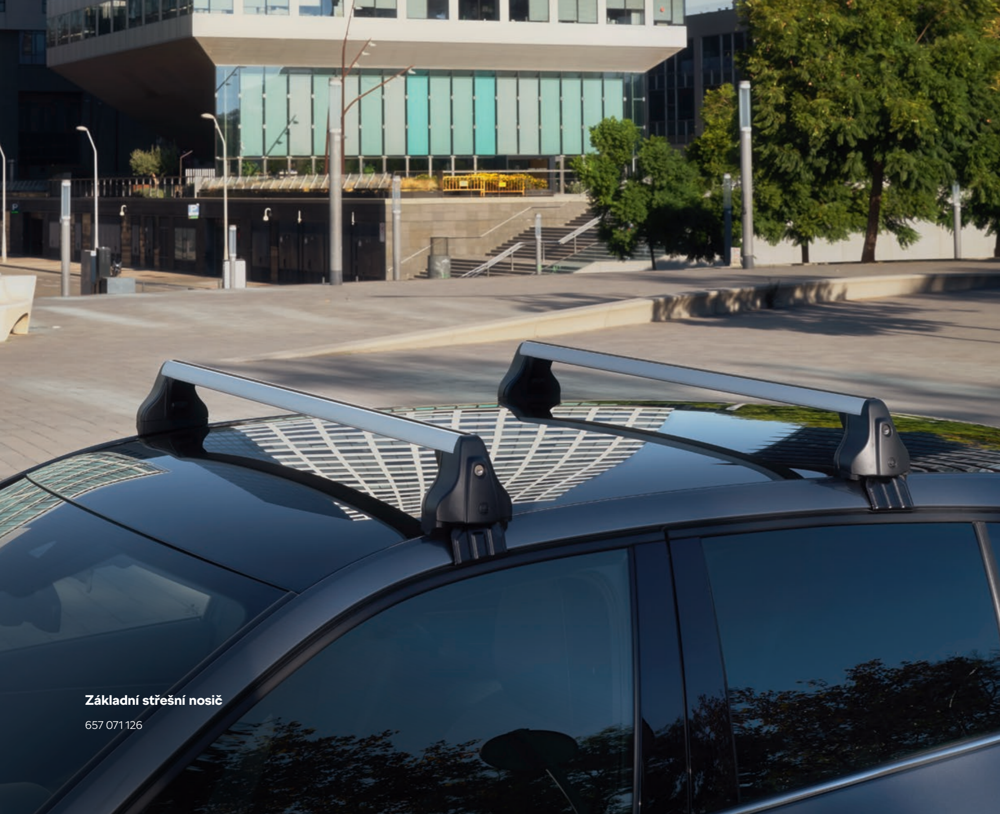
Základní střešní nosič