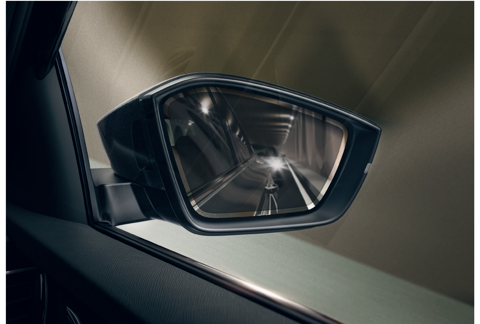
Automaticky stmívatelné zrcátko spolujezdce