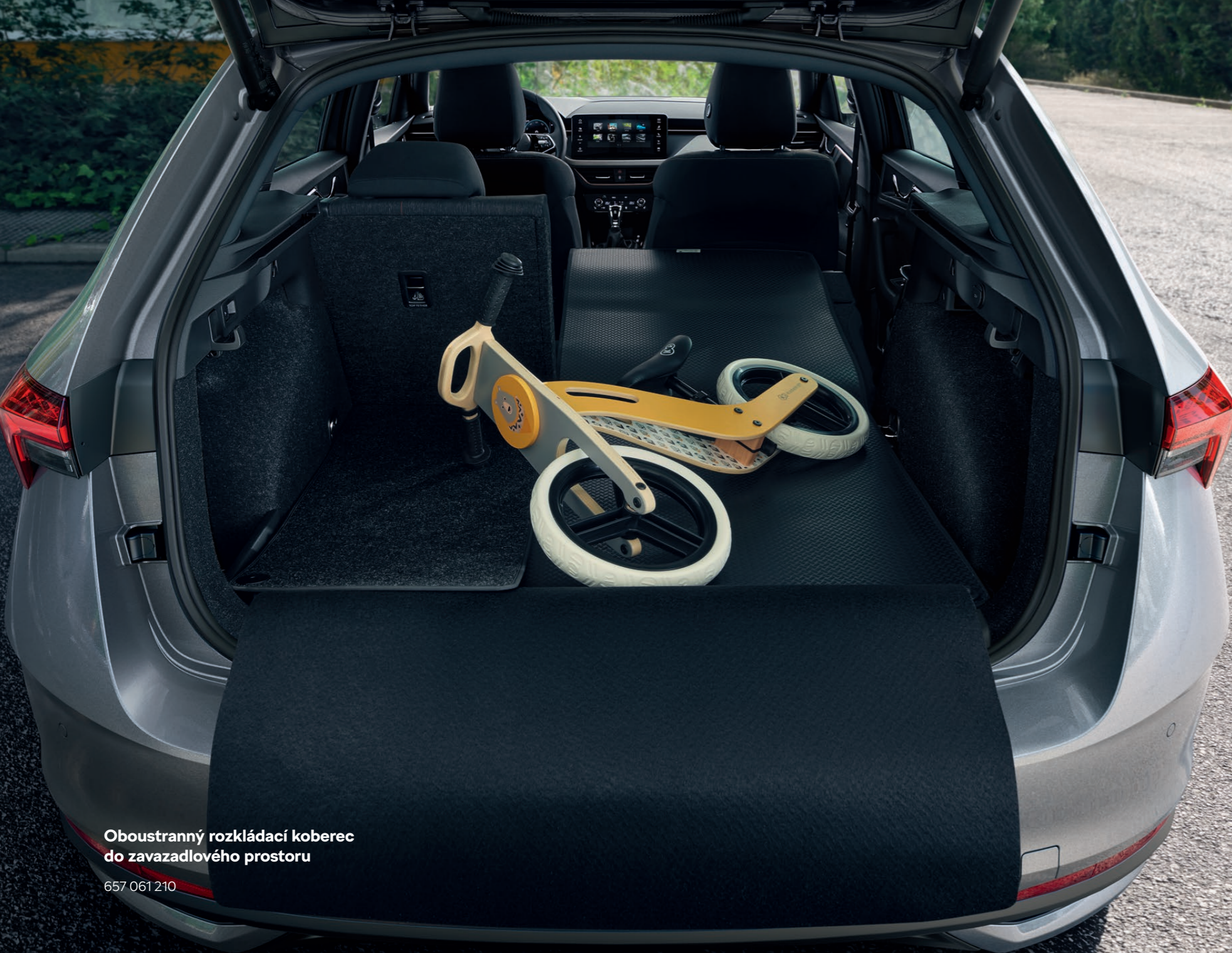
Oboustranný rozkládací koberec do zavazadlového prostoru